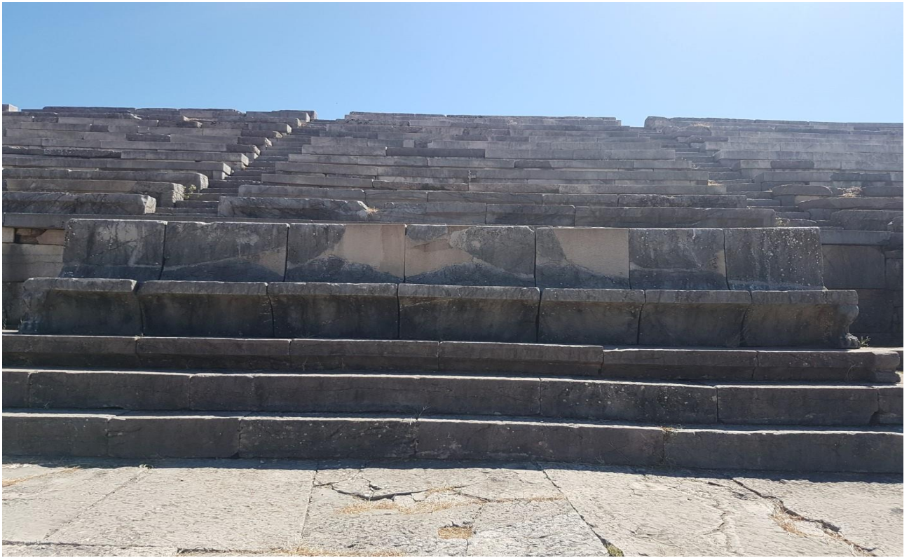
7 – 8) VEDUTA TRONI E TRONO